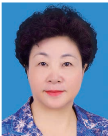
马文娟，女，回族，1965年2月生，大学，中共党员。现任宁夏回族自治区人大常委会副主任。