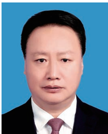
王和山，男，汉族，1964年7月生，研究生，农学硕士，中共党员。现任宁夏回族自治区人大常委会副主任。