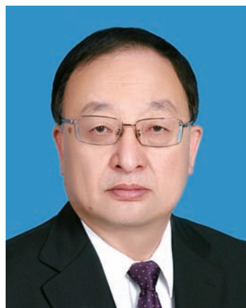
杜银杰，男，汉族，1967年1月生，中央党校研究生，中共党员。现任宁夏回族自治区人大常委会副主任，自治区党委组织部副部长（分管日常工作）。