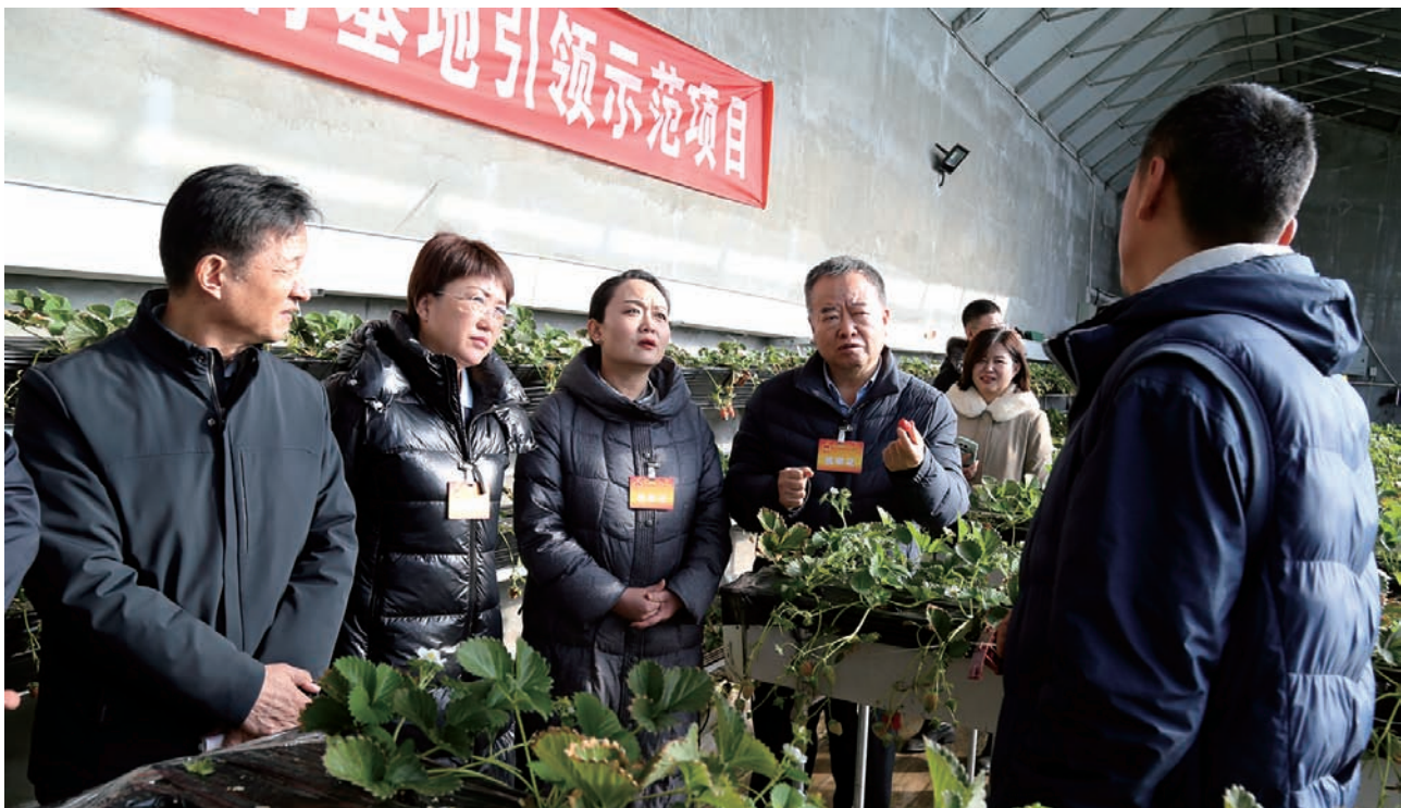
▲ 视察组在固原市原州区实地察看设施农业发展情况。